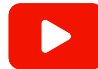
Voorbeeld 1: bijdrage voor een gezonde verzekerde